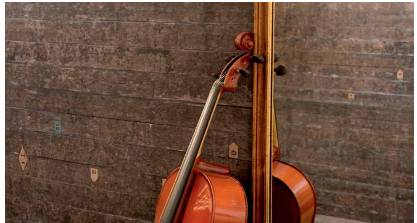
Palco 2 25x150/10"x60" R