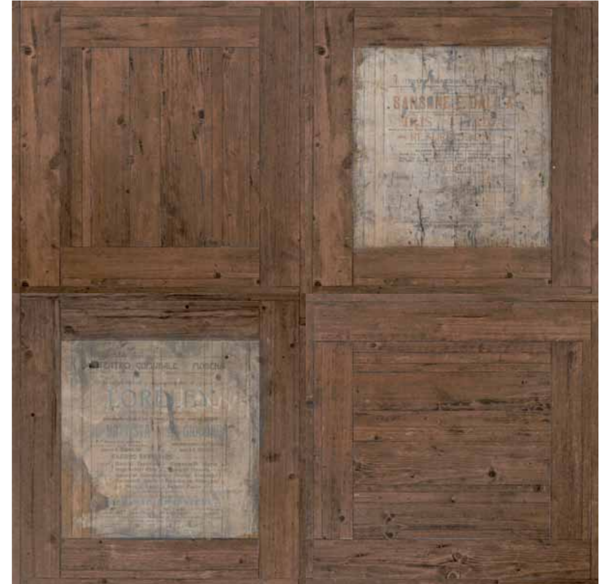
Quadro Deco 75x75/30"x30" R

8 soggetti diversi formato 75x75 (miscelazione casuale)/ 8 assorted motifs 75x75 size (random mix)/ 8 sujets differents format 75x75 (melange aleatoire)/ 8 verschiedene Motive Format 75x75 (Zufallsmischung)/ 8 verschillende ontwerpen in 75x75 (willekeurig gemengd)/ 8 motivos diferentes formato 75x75 (mezcla casual)