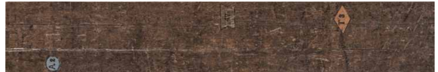
Palco 2 * 25x150/10"x60" R LT41