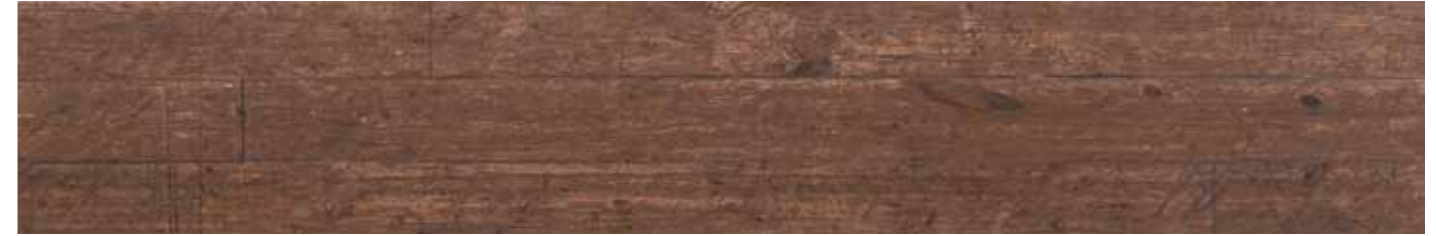
Palco 1 * 25x150/10"x60" R LT40