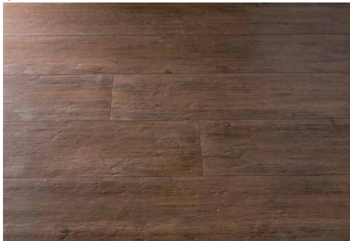
Foyer 2 25x150/10"x60" R