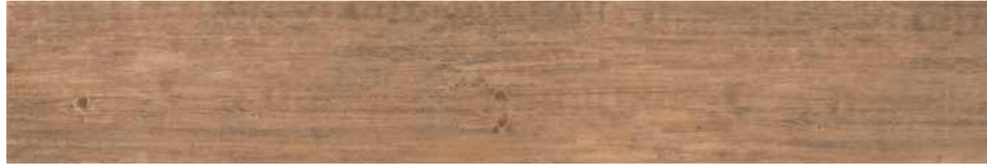
Foyer 1 25x150/10"x60" R LT08