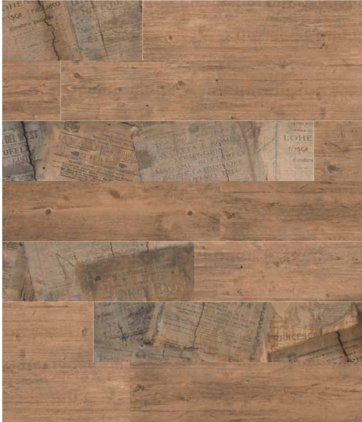
Foyer Deco 25x150/10"x60" R

6 soggetti diversi formato 25x150 (miscelazione casuale)/ 6 assorted motifs 25x150 size (random mix)/ 6 sujets differents format 25x150 (melange aleatoire)/ 6 verschiedene Motive Format 25x150 (Zufallsmischung)/ 6 verschillende ontwerpen in 25x150 (willekeurig gemengd)/ 6 motivos diferentes formato 25x150 (mezcla casual)