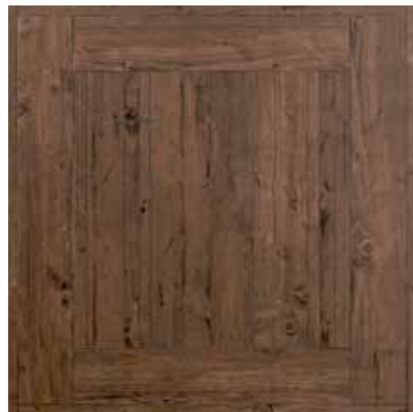
Quadro 75x75/30"x30" R LS32