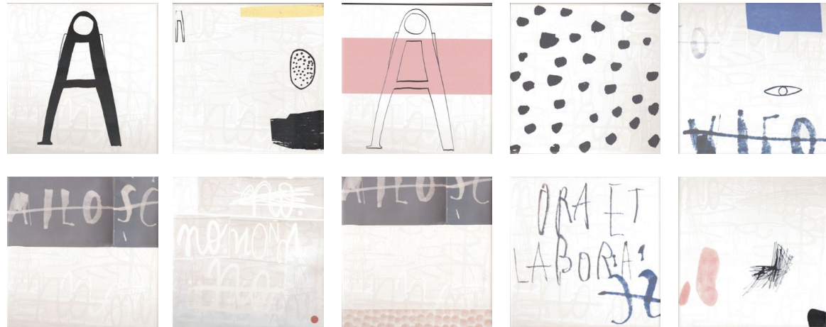
Relax Mix* 20x20 cm