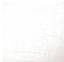
Relax Blanco* 20x20 cm