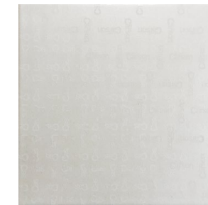
3D Carson Blanco* 20x20 cm